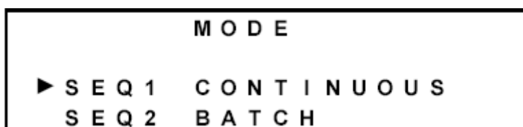
图 24 模式选择界面

样品序列生成器能够以两种不同模式来工作，这取决于所用的测定仪的类型。连续模式用于连续型输出测定仪，例如：钠、电导率、pH 值、O 2 、一些比色值和很多其它。分批模式是用于“单点”或者分批采集样品的测定仪，然后花费一些时间来分析样品，在此之后输出一个新的固定的模拟信号。这个模式可以从模式选择 (Mode Selection) 界面中更改。